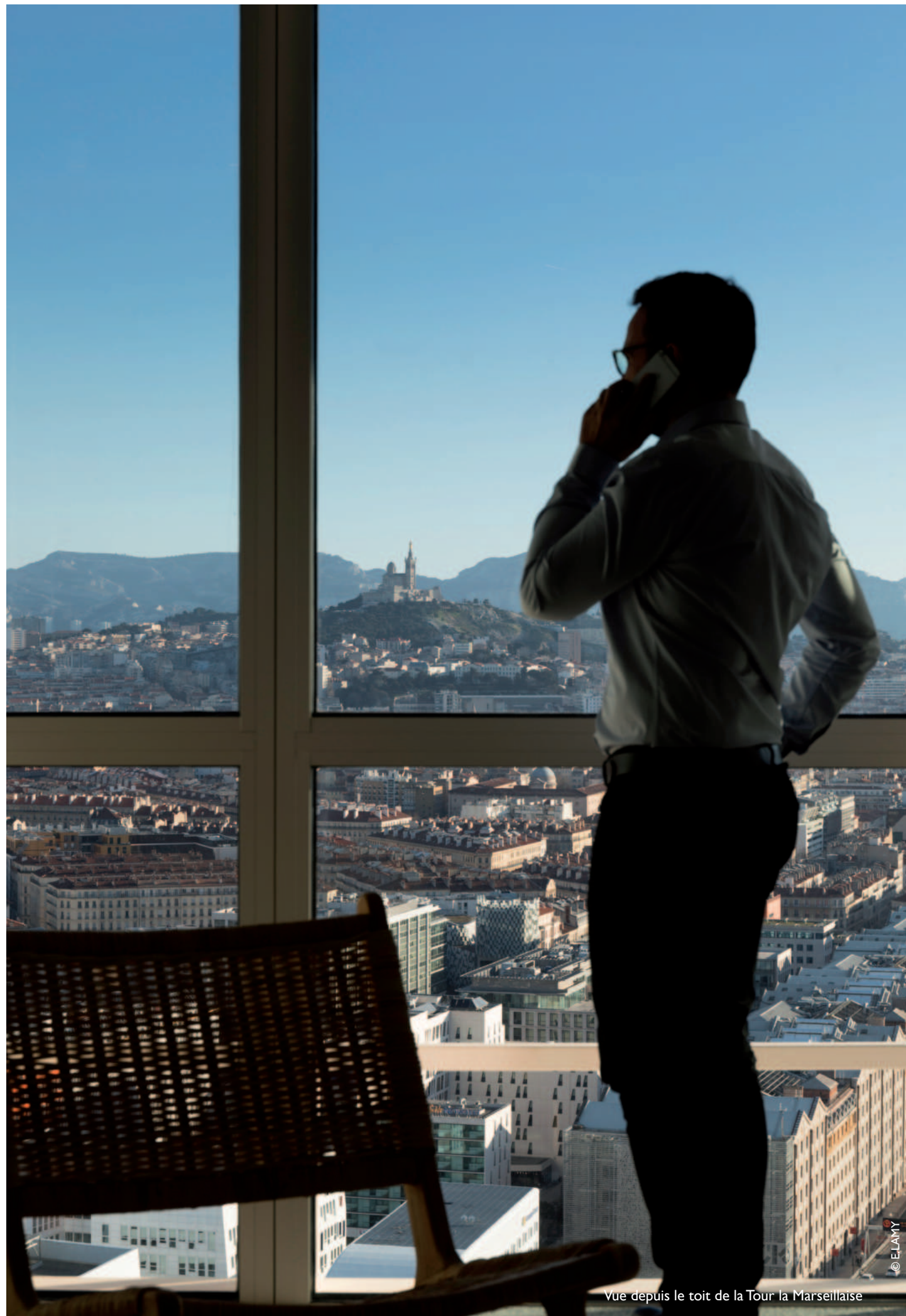
vue depuis le toit de la Tour la Marseillaise