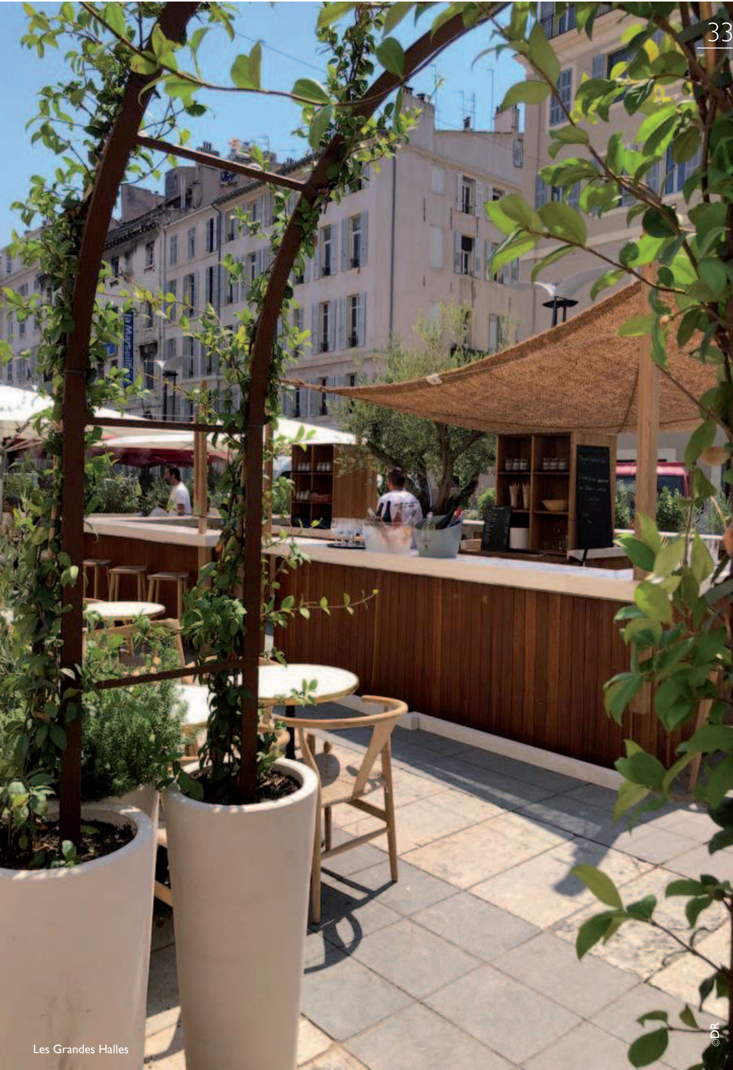
Les Grandes Halles