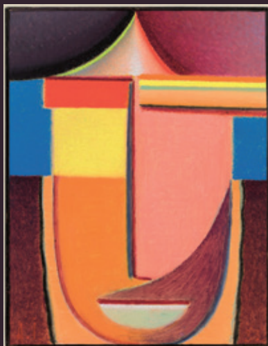
Alexej von Jawlensky, tête abstraite : Karma (1933). Coll. particulière.