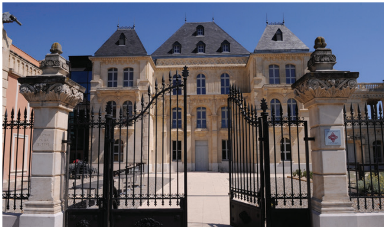
Le Château de la Buzine